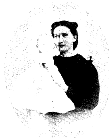
Auf dem Arm der Mutter

Von den umwälzenden Änderungen nach Abklingen der Rokokozeit war auch Pommern nicht unberührt geblieben. Durch die Französische Revolution war mit manchem, das als unantastbar galt, aufgeräumt worden. Neben dem Glauben an Gott als höchste Instanz und Mittelpunkt